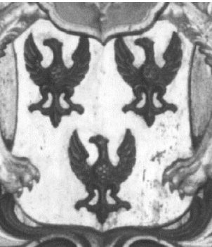
Het wapen van Van Echten en het 'wapenstuk'.

bouw en de verbouwing ( 'Anno 1652 gebouwt, anno 1766 vergroot' ). De tekst zegt niets over vergrotingen van latere datum, en de gebruikte lettering is eerder 18 de dan 17 de eeuws. Wat verder opvalt is, dat het schild, omgeven door een cartouche, vrij leeg is. Twee opmerkingen over bouw en verbouw, en dat is het. Het was esthetisch gezien mooier geweest om grotere letters te gebruiken of deze kleinere lettering aan te brengen op een kleiner vlak, als we er tenminste van uit gaan dat het de bedoeling was dat de steen er zo